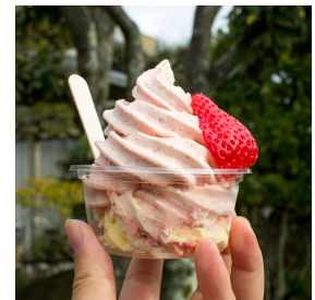
商品参考イメージ